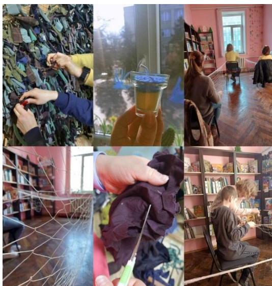
Фото 2. Заходи приурочені допомозі ЗСУ

Разом працівники та діти плели маскувальні сітки з ниток вручну та за допомогою спеціальних дерев'яних рамок-планшетів. Такі сітки використовуються військовими для маскуванню техніки, укриття від снайперів, створення бліндажів.