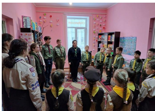
Фото 3. Заходи з пластунами