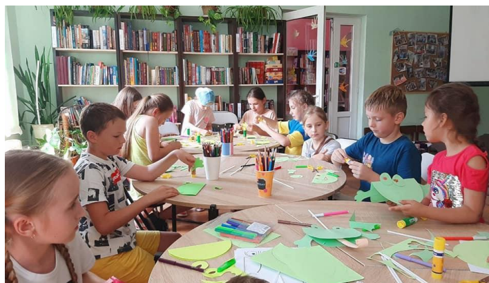
Фото 1. Паперова фантазія

Бібліотекарі надавали інструкції, допомагали освоїти нові техніки. Діти обирали теми та персонажів для своїх робіт. Після закінчення виробу зберігались в бібліотеці або забирались додому на згадку. (див. фото 1) [3].