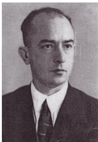
Я н П у х а л ь с ь к и й