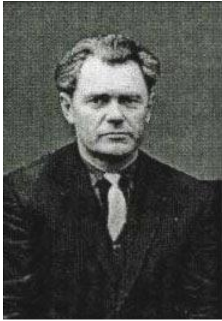
Б о р и с Ш о п е н