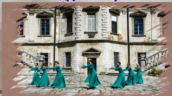
Грузинський народний танець як засіб втілення хореографічного образу в сюїті «Душа Кавказу»