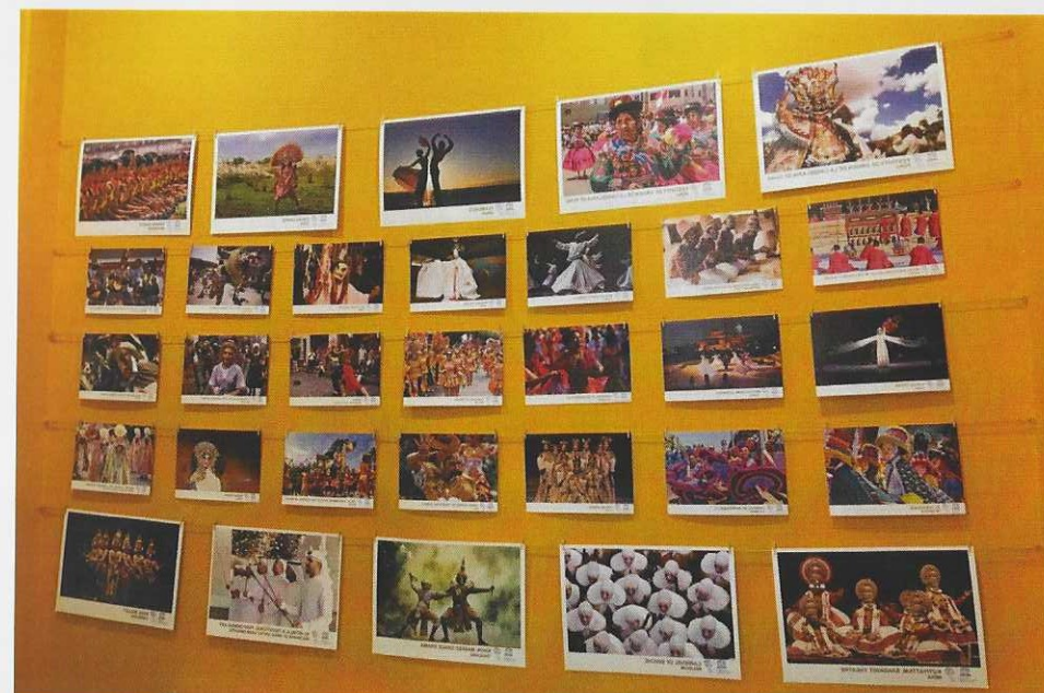
Photo Exhibition "Masterpieces of the dance culture of mankind" according to the List of Intangible Cultural Heritage prepared under the UNESCO program «Masterpieces of the Oral and Intangible Cultural Heritage of Humanity».

Конвенція ЮНЕСКО 2003 року про національну охорону нематеріальної культурної спадщини покликана зберегти цю тендітну спадщину, забезпечити її життєздатність і створити умови для повного розкриття її потенціалу в інтересах сталого розвитку. Діяльність ЮНЕСКО в цій галузі спрямована на підтримку держав-членів у всьому світі, сприяння міжнародному співробітництву в захисті живої спадщини і створення інституційного та професійного середовища, сприятливого для охорони цього нематеріального скарбу.